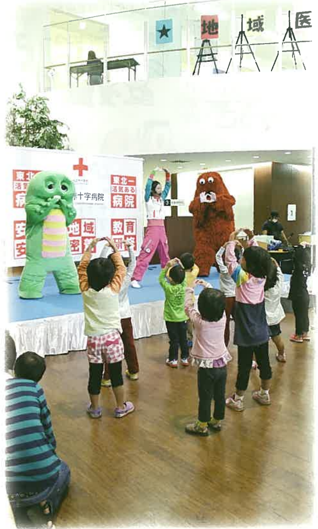
赤十字健康まつり2012での早寝早起き朝ご飯体操